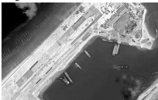
Biển cồn đá ngầm thành bến tàu và sân bay

4 - Tòa án còn ghi nhận rằng Trung Quốc đã gây thiệt hại nghiêm trọng cho môi trường của những cồn san hô và vi phạm nghĩa vụ duy trì và bảo vệ hệ sinh thái dễ bị thay đổi và nơi sinh sống của những chủng loại bị đe dọa tiêu diệt ( China had caused severe harm to the coral reef environment and violated its obligation to preserve and protect fragile ecosystems and the habitat of depleted, threatened, or endangered species ). Như vậy là Tòa chống lại việc Trung Quốc biến các bãi đá ngầm và các tụ điểm san hô thành những hòn đảo nhân tạo.